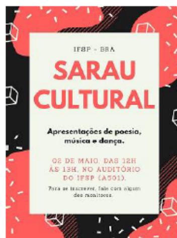
Imagem 4 – Cartaz do sarau cultural de maio de 2019

Mas sempre há espaço para produções autorais: poemas, contos e também composições musicais de autoria dos participantes.