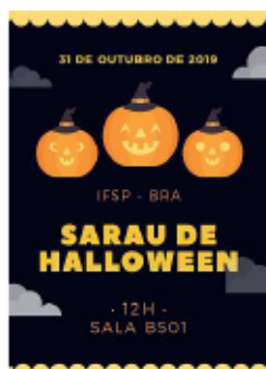
Imagem 2

Em datas especiais, foram promovidos também Saraus temáticos , como o Dia Internacional da Mulher ou Halloween (Imagens 2 e 3).