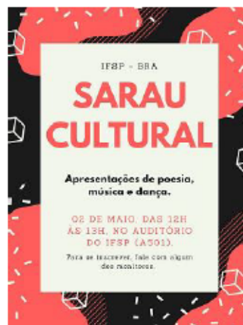
Imagem 4 – Cartaz do sarau cultural de maio de 2019

Mas sempre há espaço para produções autorais: poemas, contos e também composições musicais de autoria dos participantes.