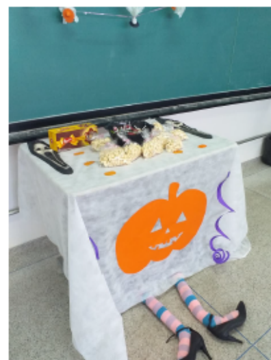
Imagem 3