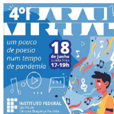
Imagem 8 – cartaz do 4º Sarau Virtual