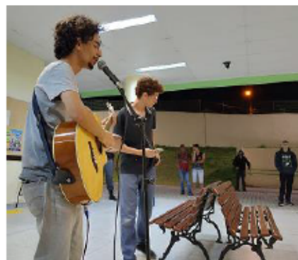
Imagem 1 – 1º Sarau do período noturno

Em 2020, no período de acolhimento dos alunos ingressantes, foi realizado o primeiro sarau do período noturno, na hora do intervalo (Imagem 1).