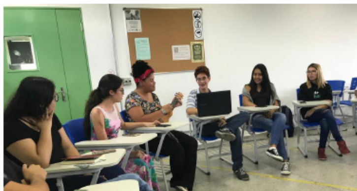
Imagem 7 – Participação no curso de extensão Mulheres de Energia (acervo dos participantes)

Em 2020, o sarau teve uma participação especial no curso de extensão Mulheres de Energia (Imagem 7).