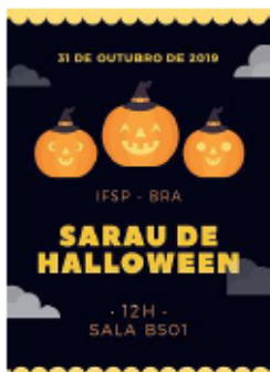
Imagem 2 (acervo dos participantes)

Em datas especiais, foram promovidos também Saraus temáticos , como o Dia Internacional da Mulher ou Halloween (Imagens 2 e 3).