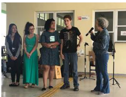
Imagem 6 – Sarau da Bragantec 2019

O projeto de ensino Saraus ao meio-dia tem participado da programação cultural de outros eventos do câmpus, tais como a Semana da Diversidade (Imagem 5) e a Bragantec (Imagem 6).