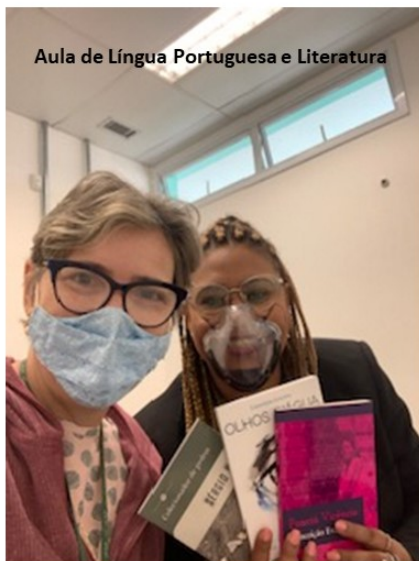
Aula de Língua Portuguesa e Literatura