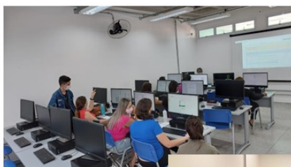
Figura 3: Aula com o Geogebra para o ensino de estatística com a participação ativa dos estudantes do curso de licenciatura em matemática.

Os recursos tecnológicos foram utilizados e o software escolhido foi o Geogebra.