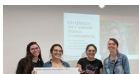
Figura 4: Apresentação do trabalho desenvolvido em suas respectivas escolas.

Acreditando que o ensino deve partir do conhecimento sobre o desenvolvimento conceitual dos alunos, envolvemos os professores cursistas num processo ativo de construção do conhecimento através da observação do desenvolvimento de seus alunos, reflexão sobre as observações e registros realizados, proposição de soluções a partir da análise de sua prática e autoavaliação do seu processo formativo ao longo do curso.