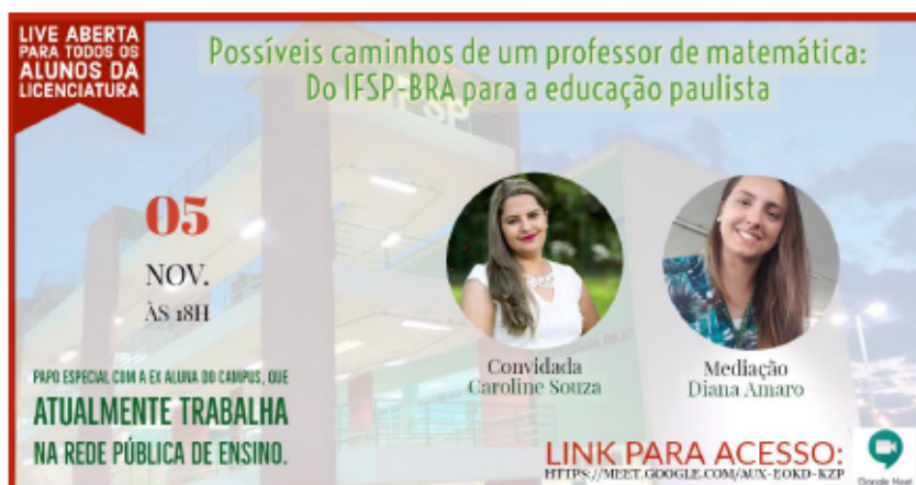
Figura 3: Convite de uma live aberta realizada com a comunidade acadêmica.