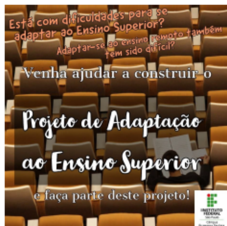
Figura 2: Convite para participar do projeto.