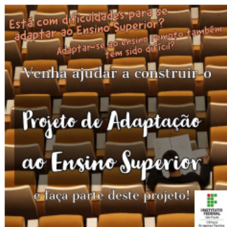
Figura 2: Convite para participar do projeto.